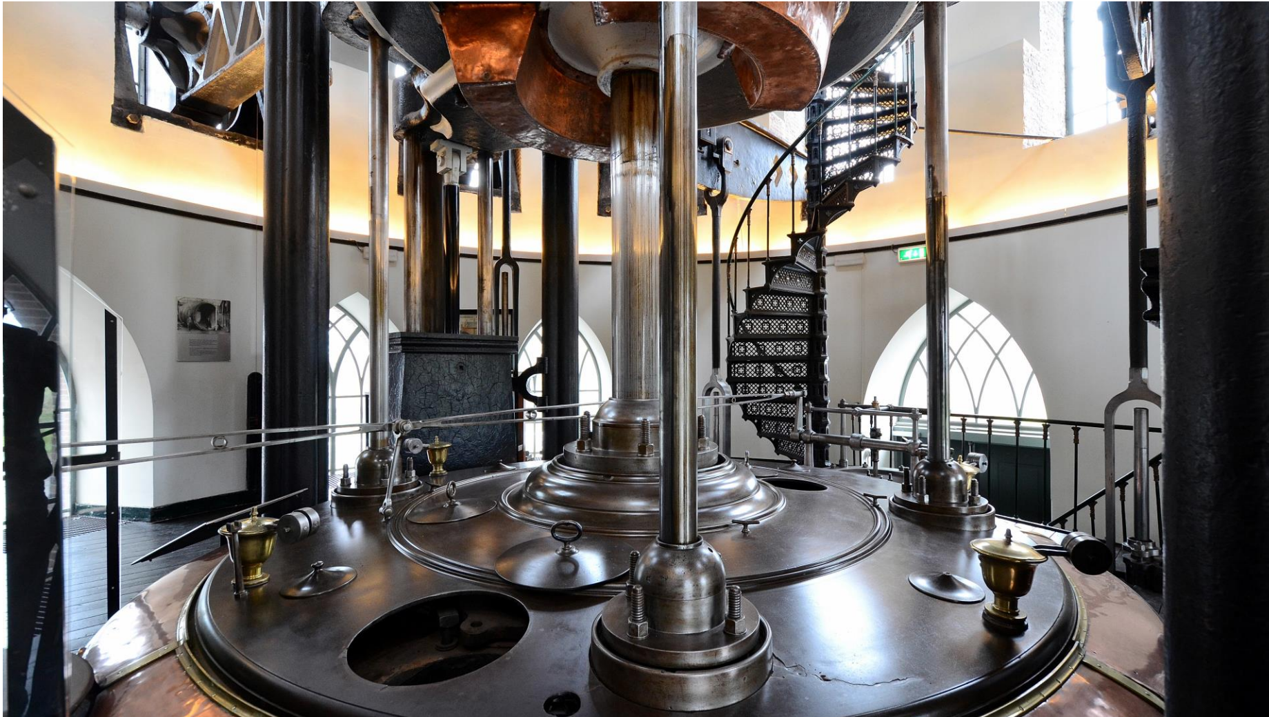
The worlds largest steam engine